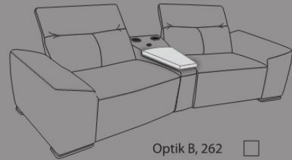
Optik B, 262

Gesamthöhe: 75 cm (ohne Kopffunktion) 90 cm (mit Kopffunktion) Sitztiefe: 160 cm (mit Relaxfunktion) 110 cm (ohne Relaxfunktion) Sitzhöhe: 45 cm Sitztiefe: 60 cm